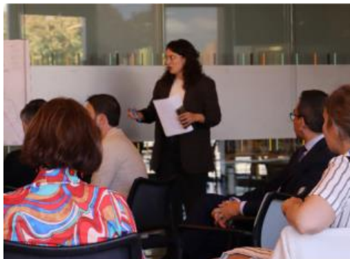
Междуведомствен семинар за съвместно създаване (проект URBREATH, 2024 г. Мадрид, Испания)