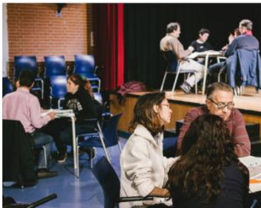
Ilustración 5. Пространство за споделяне на предложения (Clever Cities, 2018. Мадрид, Испания)