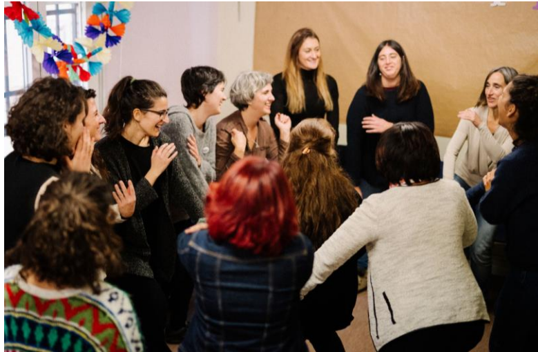
Пространство за участие, изслушване и сближаване между жените (Проект Imagina Madrid, 2019 г. в Мадрид, Испания)