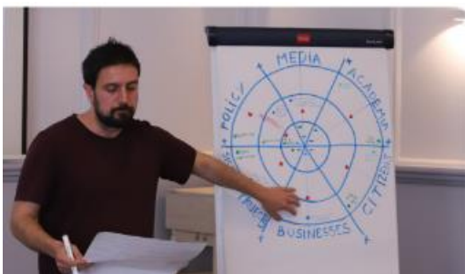
Годишна оценка на процеса (Проект за лекота, 2023 г. Вроцлав, Полша)