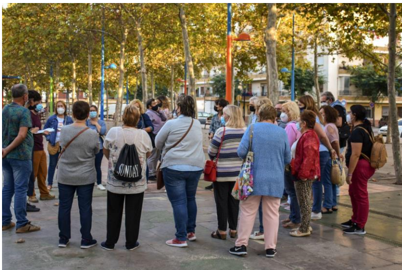
Разходка в квартала в Орба (Местен план за действие, 2022 г., Валенсия, Испания)

Този проект е финансиран от Програмата за научни изследвания и иновации LIFE на по Споразумение за безвъзмездна финансова помощ No 101120859