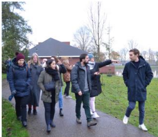
Разходка с участие (Проект за лекота, 2022 г. Амстердам, Холандия)