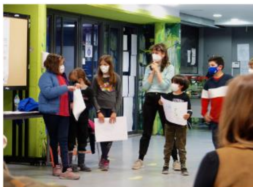
Работилница за съвместно създаване с деца (La Creativa, 2022. Мадрид, Испания)