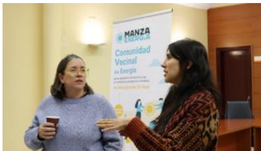
Представяне на проекта в Общо събрание (Lightness Project, 2023. Мадрид, Испания)