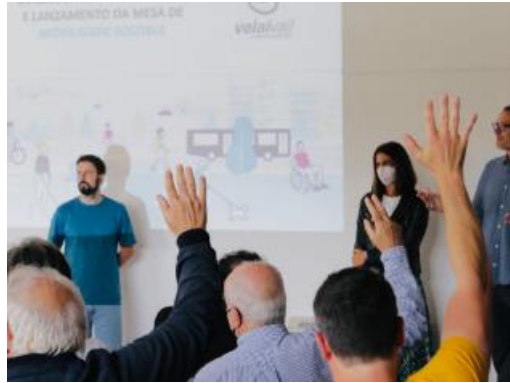
Ilustración 4. Семинар за мозъчна атака по плана за мобилност (ПУГМ Vilagarcía de Arousa, Испания)

въздържат коментарите си за идеите на други хора. Структурираното мислене и организиране могат да дойдат след това.