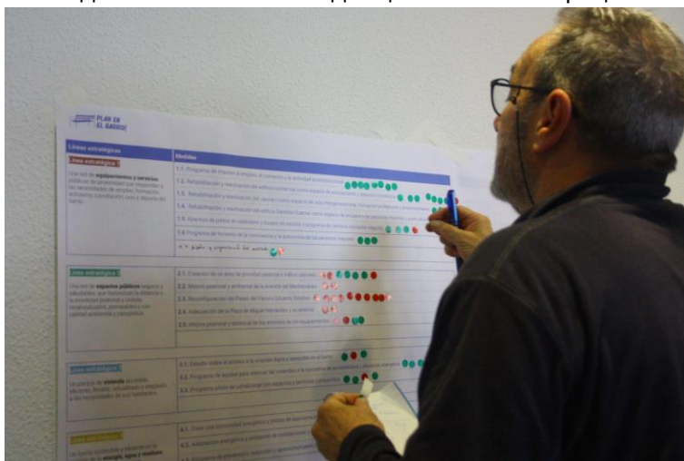
Работна среща по предложение или градоустройство (Местен план за действие, 2022 г., Валенсия, Испания)