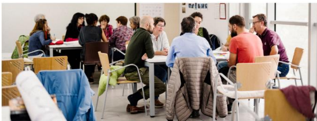
Ilustración 6. Групи за обсъждане на различни предложения (Промислен план, 2019 г. Мадрид, Испания)

Този проект е финансиран от Програмата за научни изследвания и иновации LIFE на по Споразумение за безвъзмездна финансова помощ No 101120859