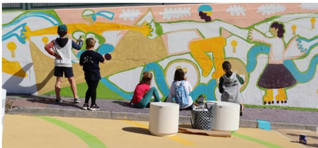
Работилница за детски стенописи в държавното училище (Talaia Alai, 2023. Хондарибия, Испания)

Този проект е финансиран от Програмата за научни изследвания и иновации LIFE на по Споразумение за безвъзмездна финансова помощ No 101120859