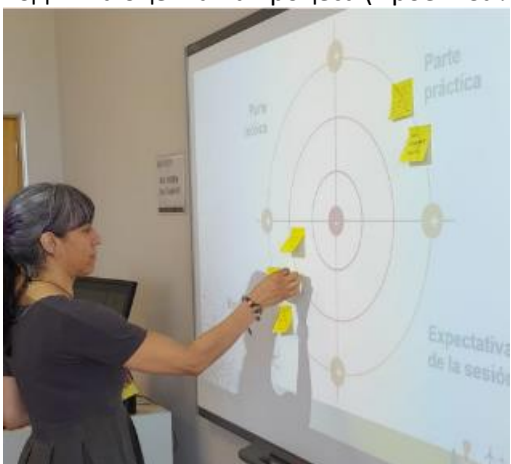
Оценка на участието на обучението (Обучение за енергийните общности, 2024 г. Понферада, Испания)