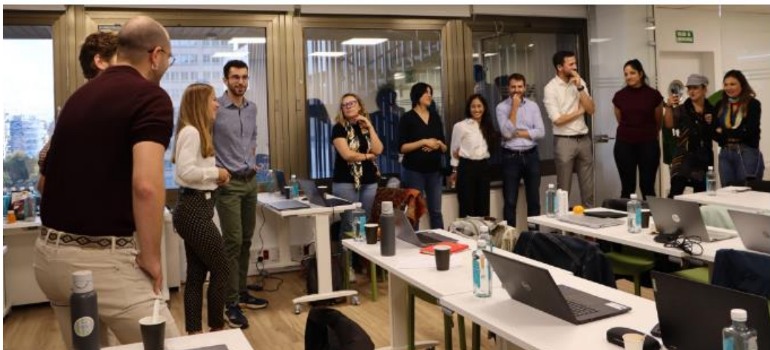
Заклучителни стъпки на Общото събрание (Проект за лекота, 2023 г. Мадрид, Испания)