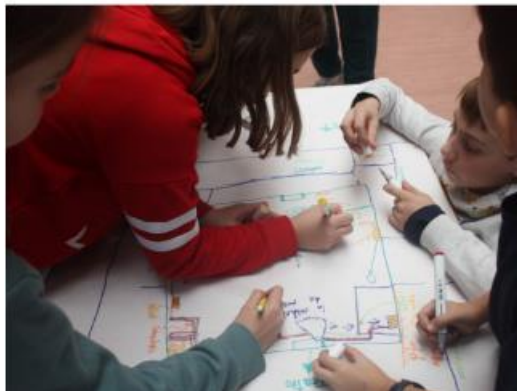
Обиколка на енергийното училище (ManzaEnergía, 2022. Мадрид, Испания)