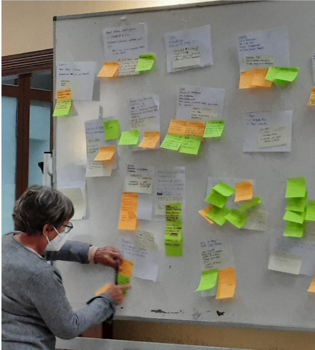
Фигура 7. Работилница за изграждане на общност (ManzaEnergía, 2021. Мадрид, Испания)

Този проект е финансиран от Програмата за научни изследвания и иновации LIFE на по Споразумение за безвъзмездна финансова помощ No 101120859