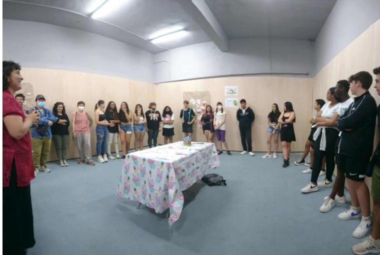
Лична игра с тийнейджъри за изменението на климата и хранителните системи (Проект "Хранителна вълна", 2022 г., Мадрид, Испания)