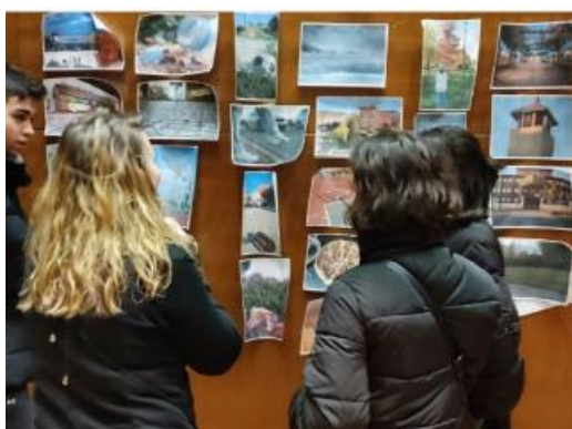
Фотографска работилница (Photovoice Alcalá de Henares, 2023. Мадрид, Испания)