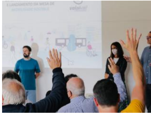
Figura 4. Workshop di brainstorming sul Piano di Mobilità (SUMP Vilagarcía de Arousa, Spagna)