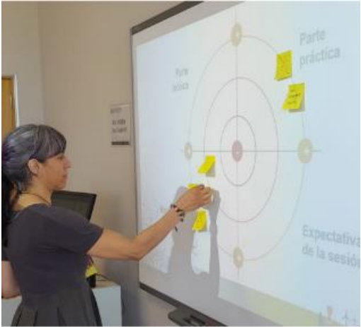
Valutazione partecipativa della formazione (Formazione sulle Comunità Energetiche, 2024. Ponferrada, Spagna)