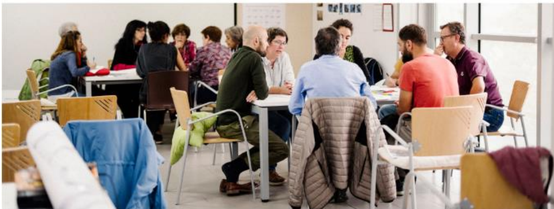
Figura 6. Gruppi per discutere diverse proposte (Piano Industriale, 2019. Madrid, Spagna)