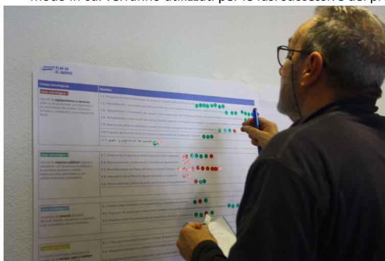
Laboratorio per la proposta o l'urbanistica (Piano d'azione locale, 2022, Valencia, Spagna)