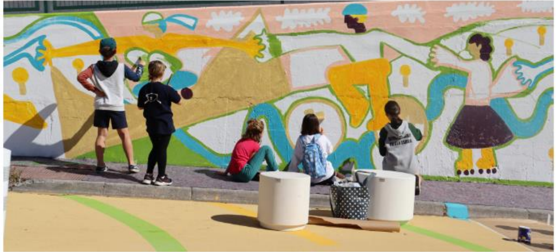
Laboratorio murale per bambini nella scuola pubblica (Talaia Alai, 2023. Hondarribia, Spagna)