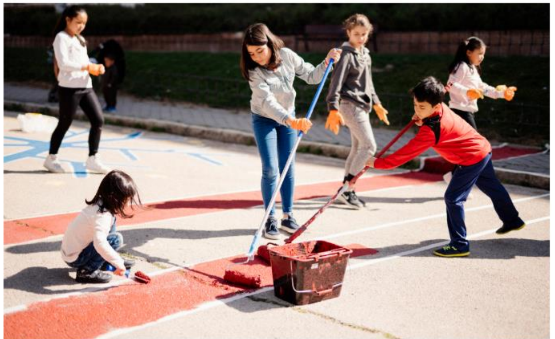
Dipingere l'azione per strada (Carlos París, 2018. Madrid, Spagna)