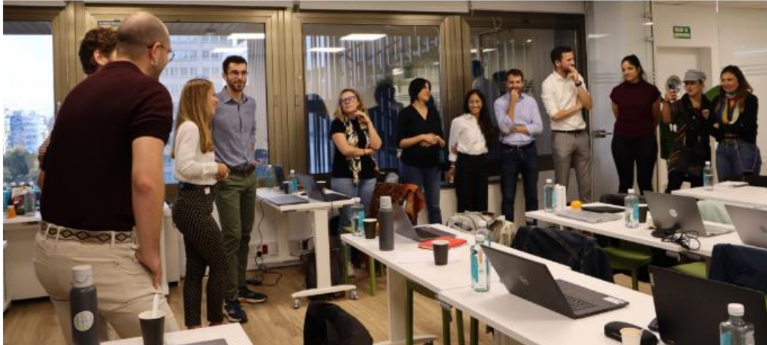
Fasi finali dell'Assemblea Generale (Lightness Project, 2023. Madrid, Spagna)