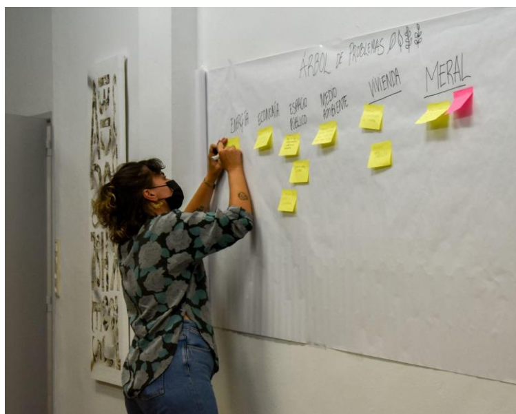
Laboratorio di diagnosi (Piano d'azione locale, 2022, Valencia, Spagna)