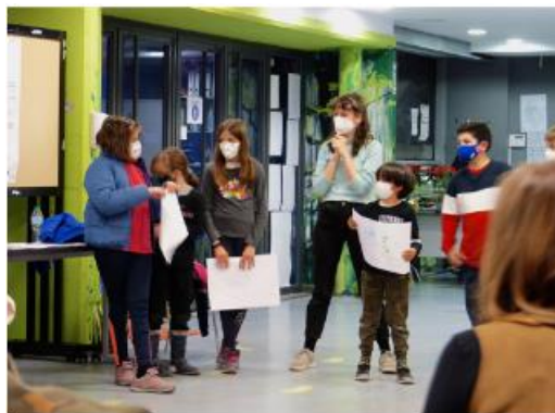
Laboratorio di co-creazione con i bambini (La Creativa, 2022. Madrid, Spagna)