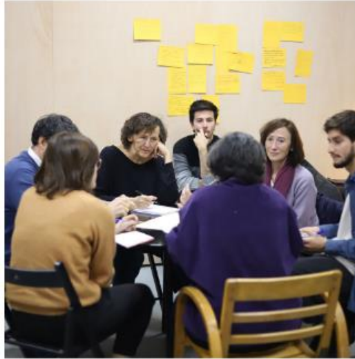
Ilustración 1. Grupo di discussione sui lavori verdi (Greener Future, 2022. Madrid, Spagna)