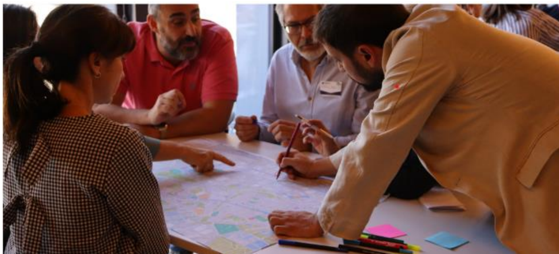
Figura 2. Workshop interdipartimentale sullo spazio archivistico (Progetto URBREATH, 2024, Madrid, Spagna)