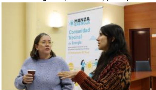
Presentazione del progetto in Assemblea Generale (Lightness Project, 2023. Madrid, Spagna)