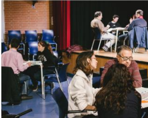
Figura 5. Spazio per condividere le proposte (Clever Cities, 2018. Madrid, Spagna)