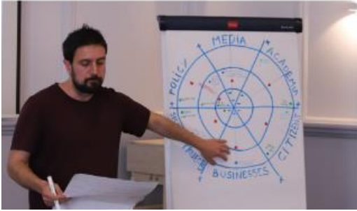
Valutazione annuale del processo (Progetto Lightness, 2023. Breslavia, Polonia)