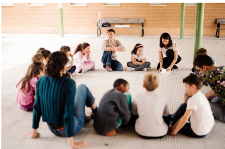
Laboratorio partecipativo con i bambini (Progetto per la trasformazione dei cortili e degli ambienti scolastici, 2019, Madrid, Spagna)