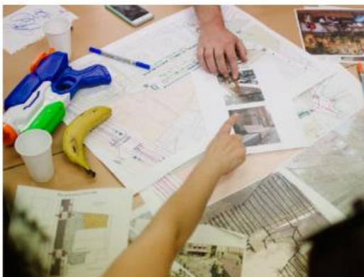
Workshop di progettazione di itinerari (Piano della Mobilità Sostenibile di Hondarribia, 2023. Paesi Baschi, Spagna)