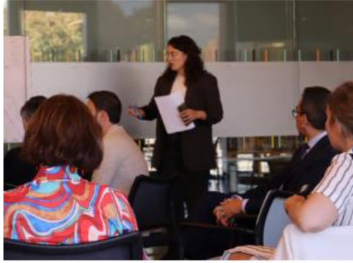
Workshop interdipartimentale di co-creazione (Progetto URBREATH, 2024. Madrid, Spagna)