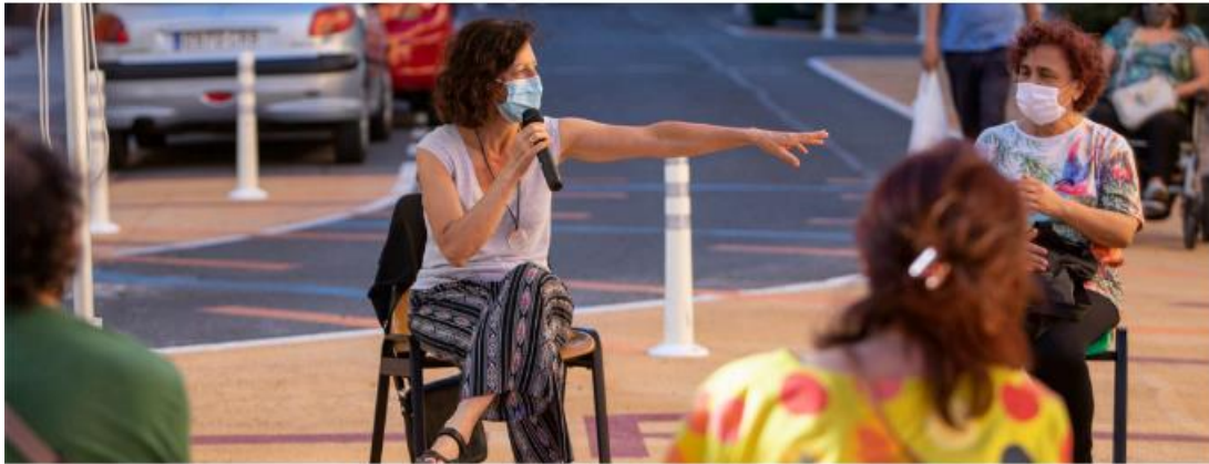
Workshop sullo spazio pubblico (Logroño Open Streets, 2019. Logroño, Spagna)