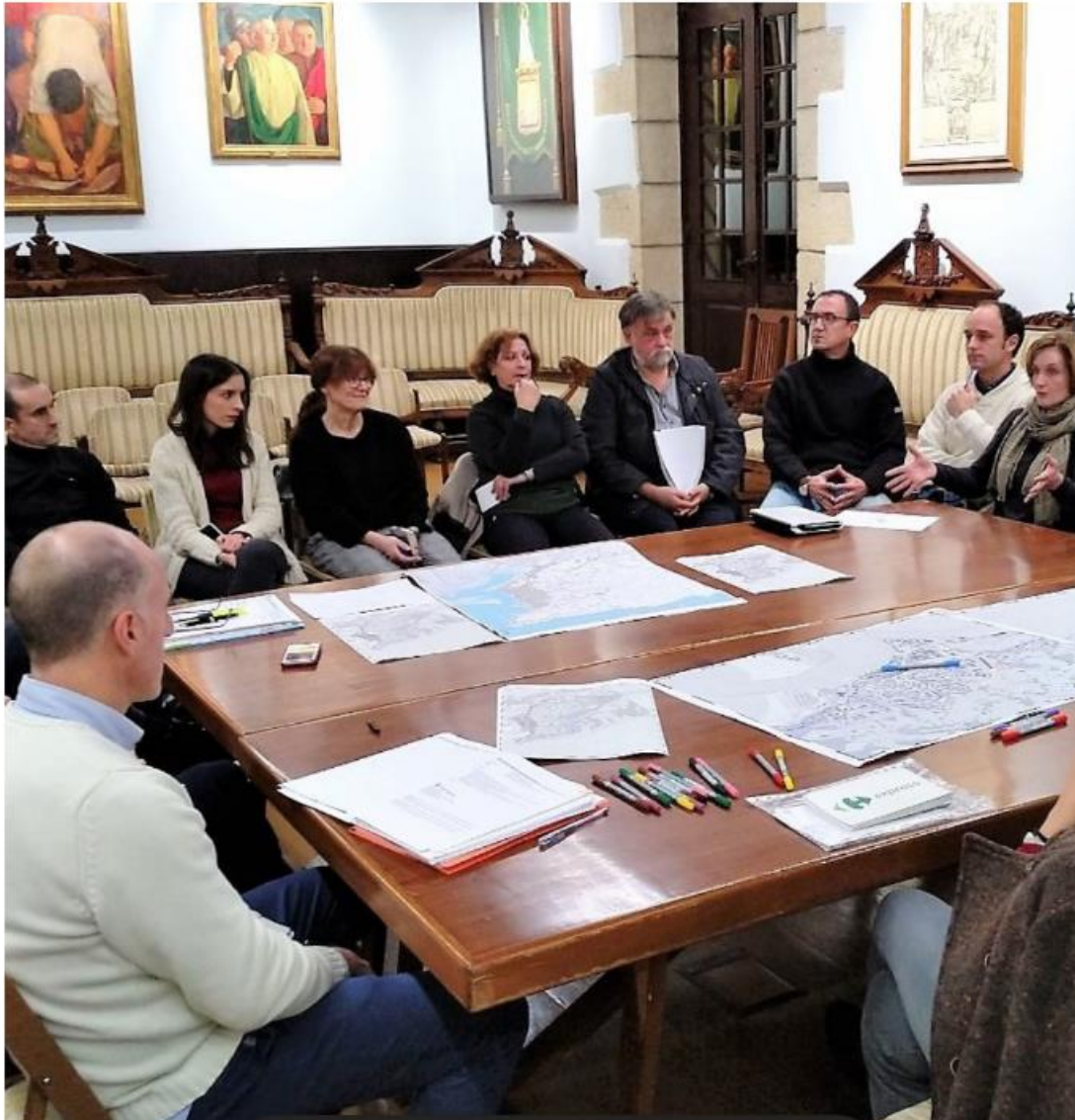
Workshop sugli scenari futuri (Piano di Mobilità Sostenibile di Hondarribia, 2018, Paesi Baschi, Spagna)

gruppi che si costituiscono, per garantire che le conclusioni includano proposte concrete di azione. Queste domande possono essere sulla falsariga di: quali azioni possiamo avviare oggi per muoverci verso lo scenario desiderato; quali persone o gruppi hanno la capacità di avviarli; quali ostacoli si possono incontrare; Come possono essere superati?