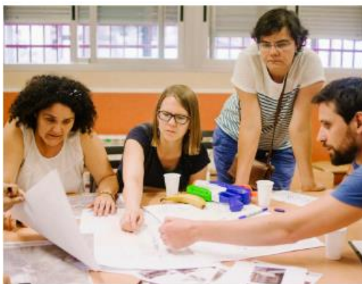
Workshop sulla mappa delle persone (Piano Industriale, 2019. Madrid, Spagna)