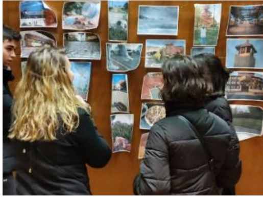
Laboratorio di fotografia (Photovoice Alcalá de Henares, 2023. Madrid, Spagna)